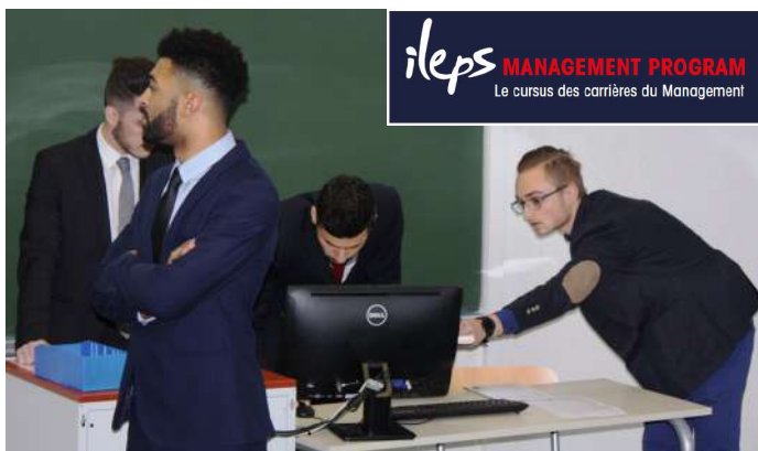
Travail de groupe avec présentation de film réalisé à l'ILEPS

Les fonctions d'encadrement, de gestion ou de développement, outre les méthodes de management classique, nécessitent une parfaite compréhension de la culture, des mécanismes et des interactions qui régissent le fonctionnement du sport.