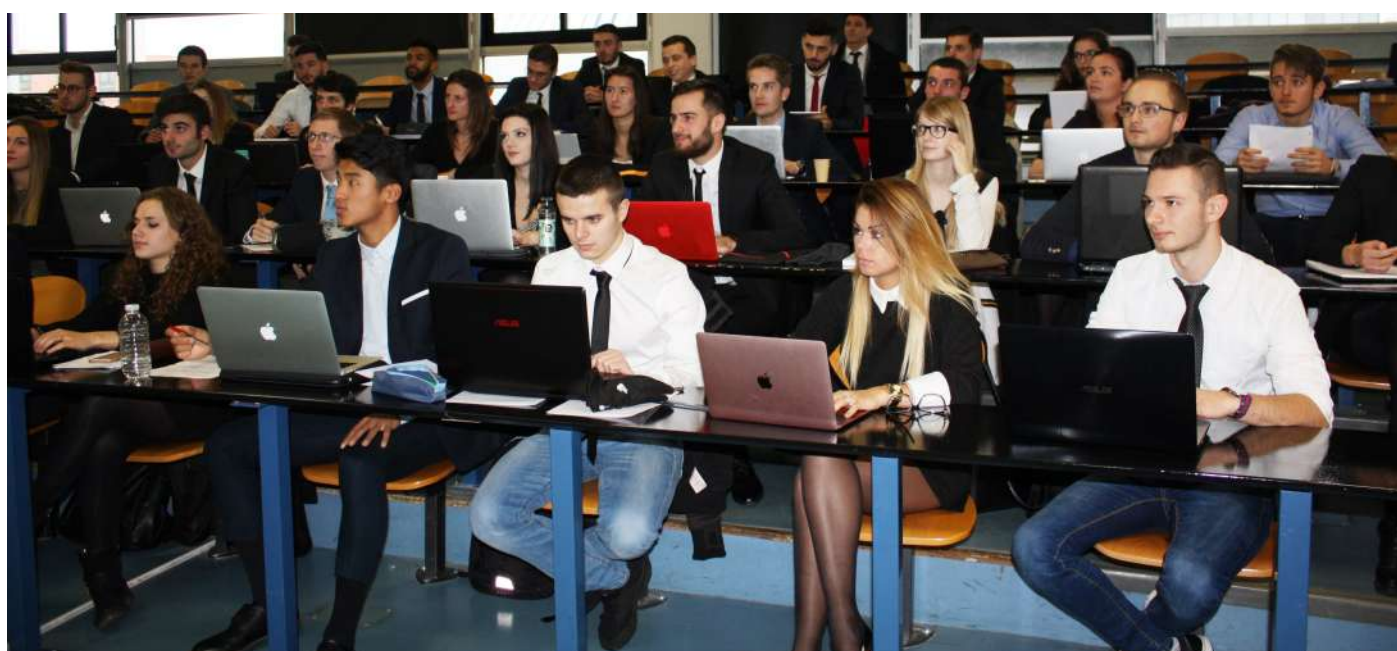
Cours de webmarketing à l'ILEPS